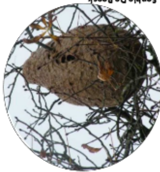
Nid de frelon asiatique :